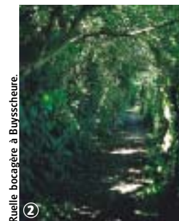
Ruelle bocagère à Buysseure.