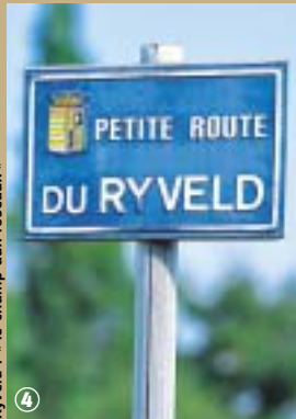
Ryveld : « le champ aux roseaux »

l'intitulé du circuit semble prometteur et il est vrai que le parcours est jalonné de richesses naturelles, architecturales et patri-