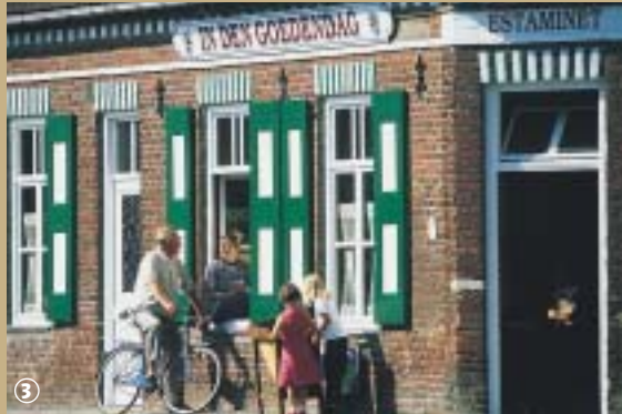
Estaminet à Bavinchove.

l'intitulé du circuit semble prometteur et il est vrai que le parcours est jalonné de richesses naturelles, architecturales et patri-