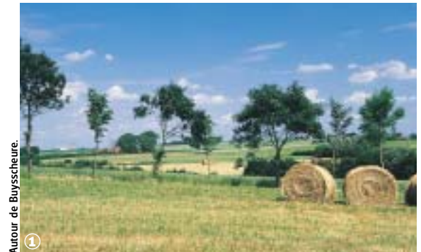
Autour de Buysseure.

Bocage Flamand et marais Audomarois, au fil de l'Yser